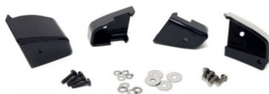
VW TRANSPORTER 5 (TRIPLE-R 750)