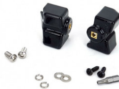
TOYOTA RAV4 HYBRID (2019+) FOR USE WITH LINEAR-18