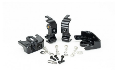
TOYOTA LAND CRUISER 200 SERIES (2015+) FOR USE WITH TRIPLE-R 750